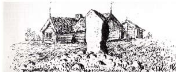
S Kedums hembygdsförening