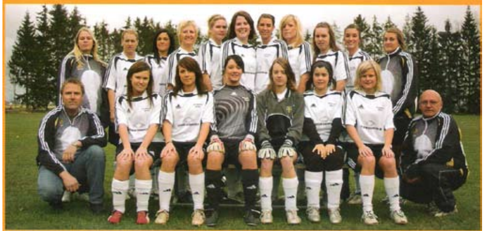
Dam- och herrtruppen 2007