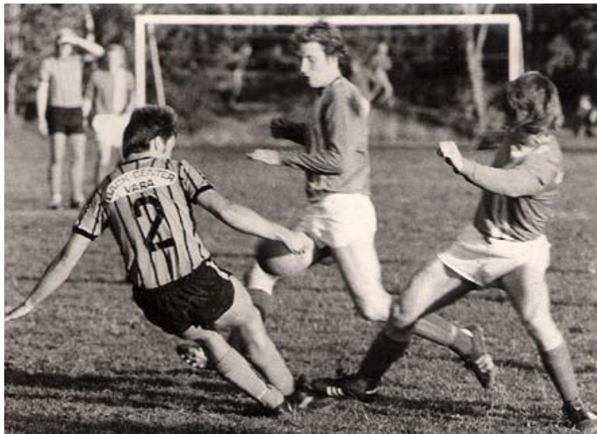
Matchbild från 1975

1 december blir det jubileumsfest i föreningshuset. Vi gratulerar jubilarerna och lyckönskar till många aktiva, framgångsrika år