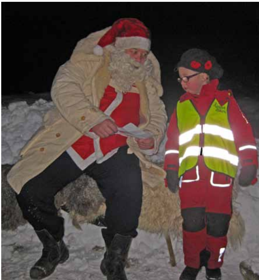
Tomten och Julia kollar önskelistan.