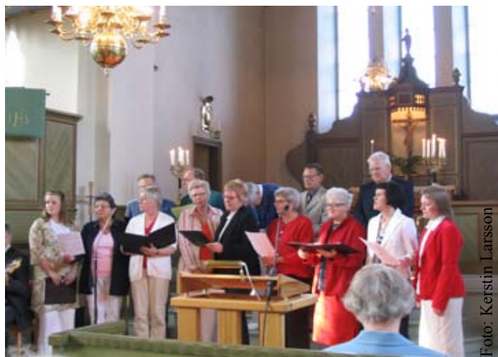
Kedumskören vid sitt framträdande i S Kedums kyrka vid Arentorpsdagen den 28 maj 2005