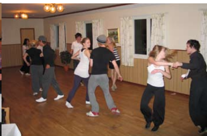
Så här nöjda och imponerade blev gästerna när de så ungdomarna dansa!