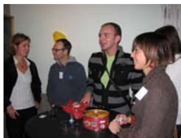
Deltagare från Polen, Nederländerna och Litauen minglar

På tisdagskvällen var det så dags för en traditionell bygdegårdsfest i Arentorps föreningshus. Gästerna bjöds på traditionellt smörgåsbord som blev mycket uppskat-