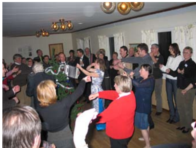
Nästan alla var med och dansade kring granen

Vid slutseminariet deltog också representanter från Polen, Lettland, Litauen, Finland och Ungern. Projektleda-