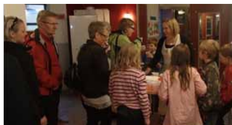
Fikat som serverades på kvällen bestod av: "Musikalmuffins toppade med grädde och strössel"