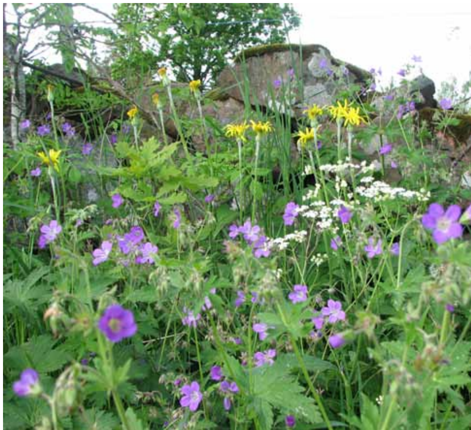
Vilda blommor i Stallberg, bl a midsommarblomster, slättegubbe och hundkex