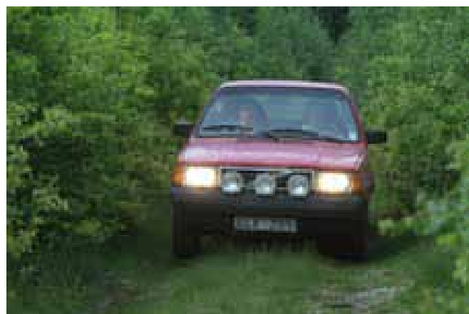
Det segrande ekipaget!

– Vi kommer snart igen, avslutar Jonas Öhman.