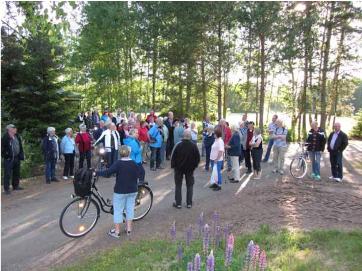
Många deltog i årets bygdevandring i Korsnaden