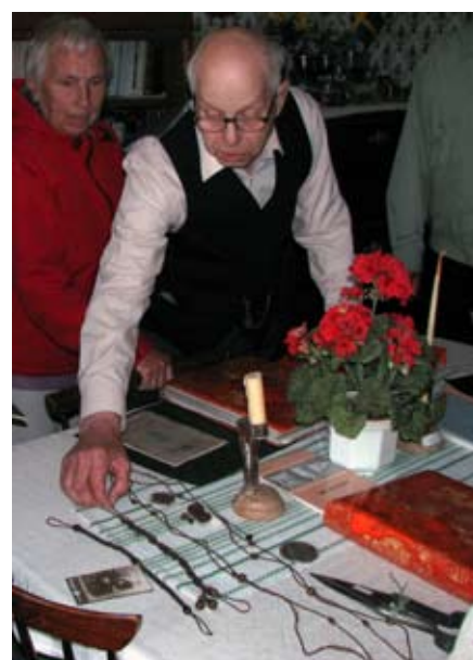
Smycken av kvinnohår