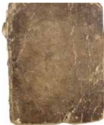
Den lilla vältummade inbundna boken.

I en bystämma deltog alla som ägde mark i en by. Stämman behandlade sådant som rörde gemensamma angelägenheter för hela byn som exempelvis hägnader, allmänningar, kvarnar m.m.