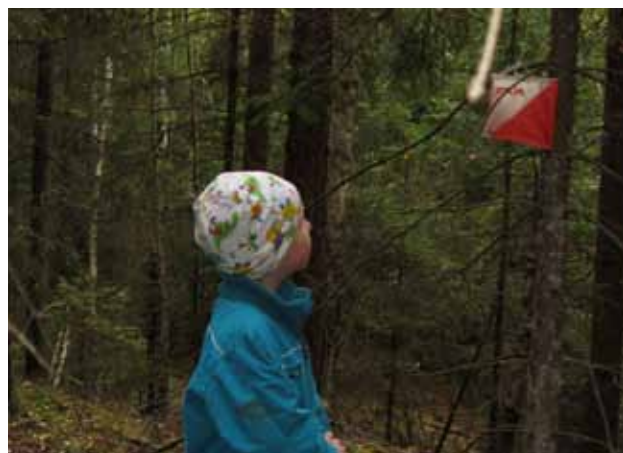
Axel tyckte det var spännande att leta kontroller!