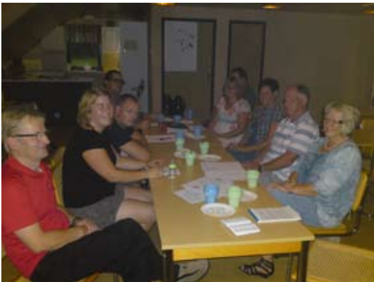
Några av kommitté medlemmarna

Fastän det är väldigt gott att äta honung, så finns det ett ögonblick alldeles innan man börjar äta den som nästan är ännu bättre. (Nalle Puh)