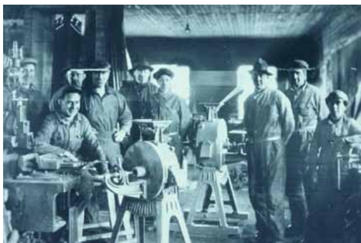
Arbetsstyrkan 1929 i verkstaden där man monterade gräpkvarnar