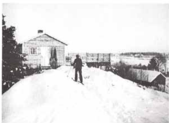
Sommarhemmet i Södra Kedum 1938.

Sommarhemmet uppfördes 1936-37 och har haft stor betydelse för junior- och scoutverksamheten i Vara missionsförsamling genom åren. Även andra organisationer har fått "låna hus och natur" som det uttryckes i något sammanhang, och för svenska kyrkans del hade det stor betydelse, innan man blev ägare till ett församlingshem på orten.