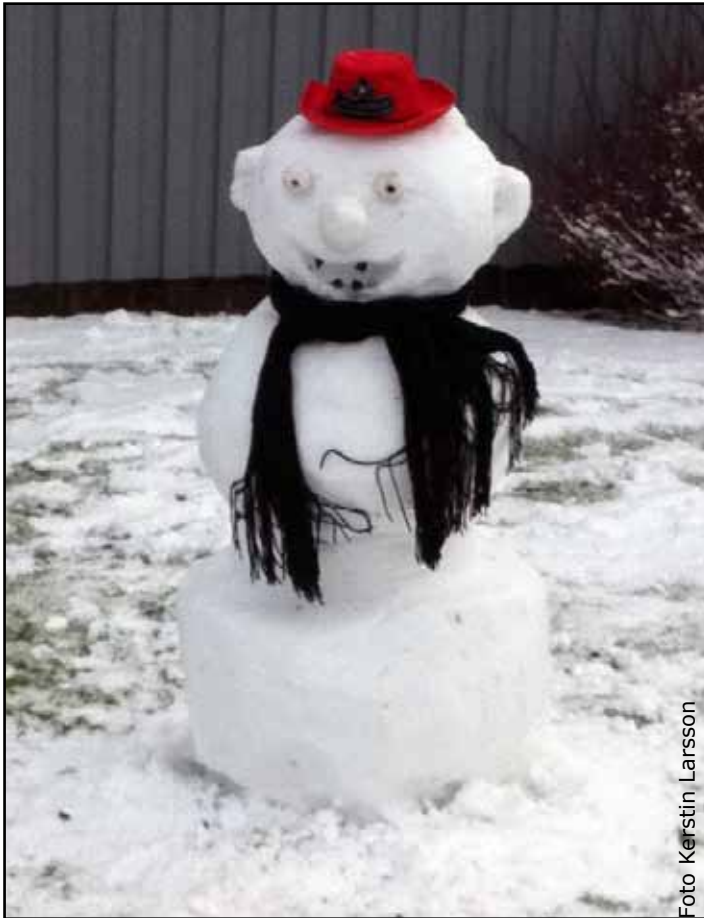
Den här fina snögubben hade både halsduk och cowboyhatt!